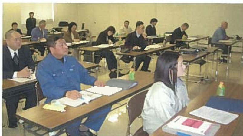
11/22経営者・経営幹部向けセミナー 「継続的な黒字会社をつくる9つの原則」開催